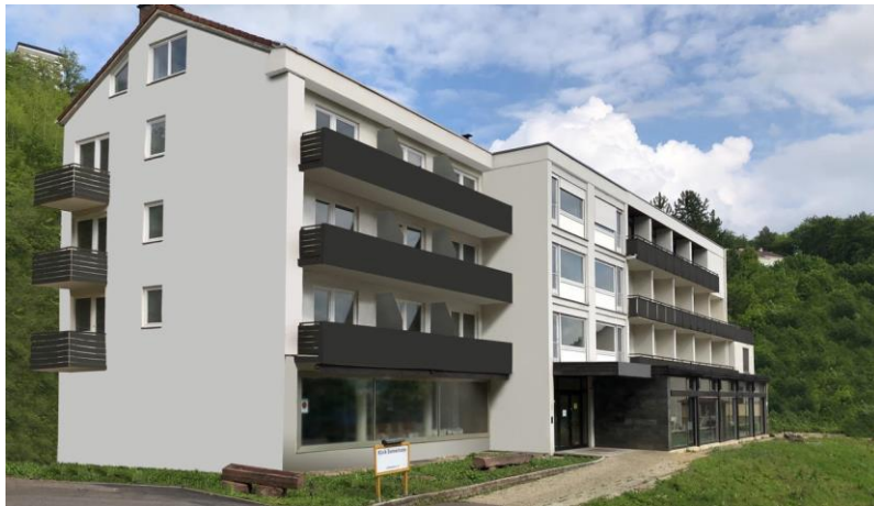
Löffelstelzer Strasse 26, 97980 Bad Mergentheim